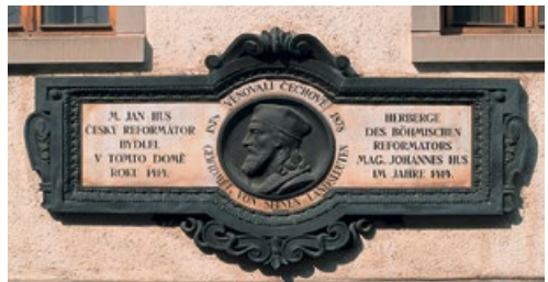
Ausflug/Exkursion Konstanz: Auf den Spuren des Reformators Johannes Hus